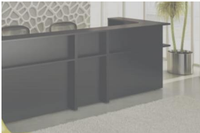
Balcão em "L"